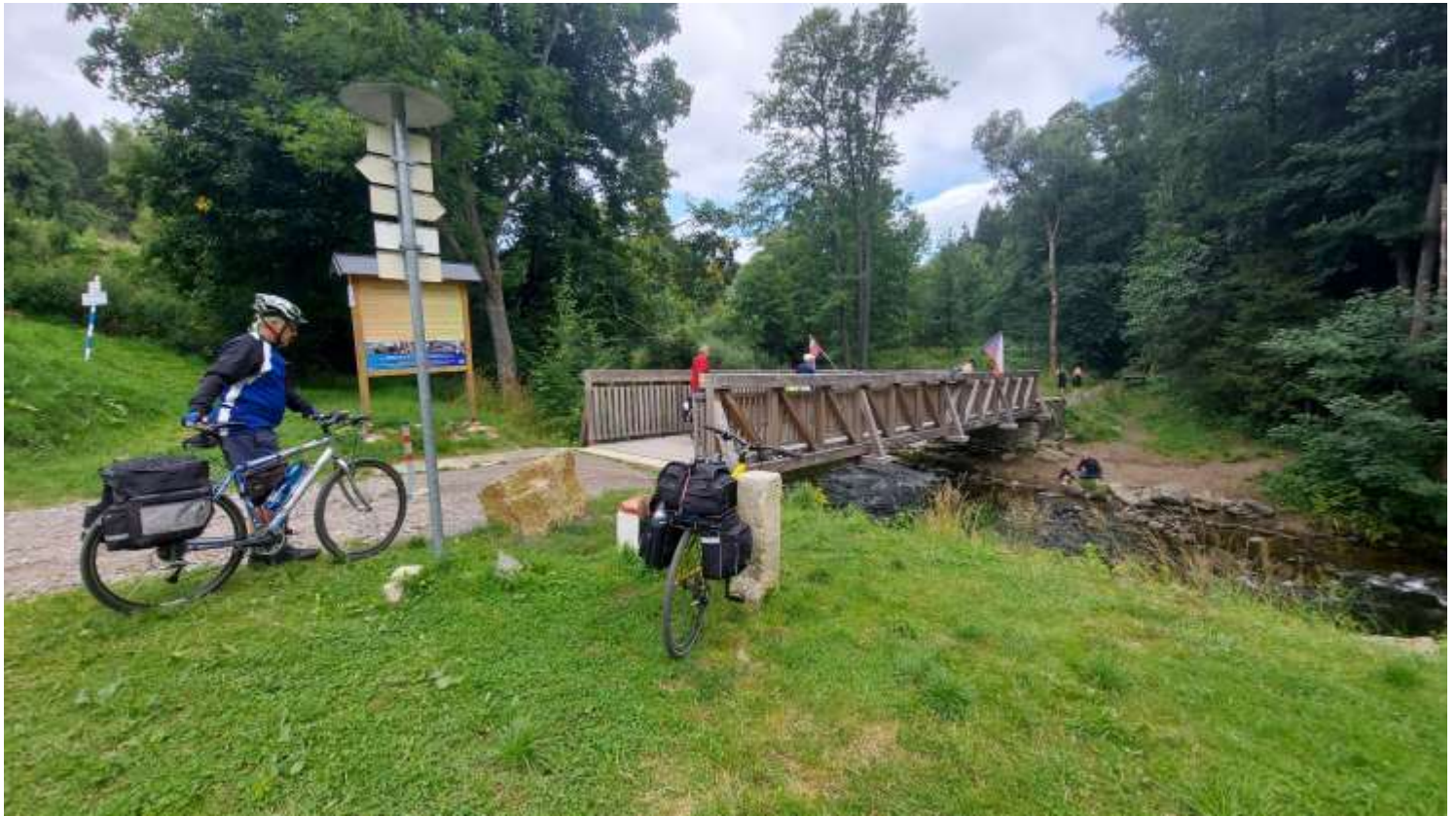
Za obcí Poniatów v dalekém Polsku, ale jen pár kilometrů.....