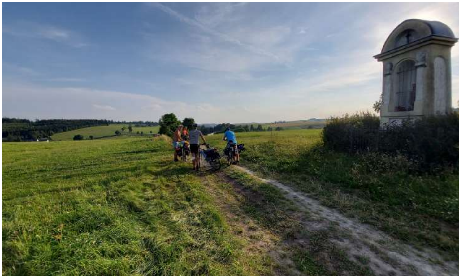
Cyklistický spolek Don't go quickly in action....