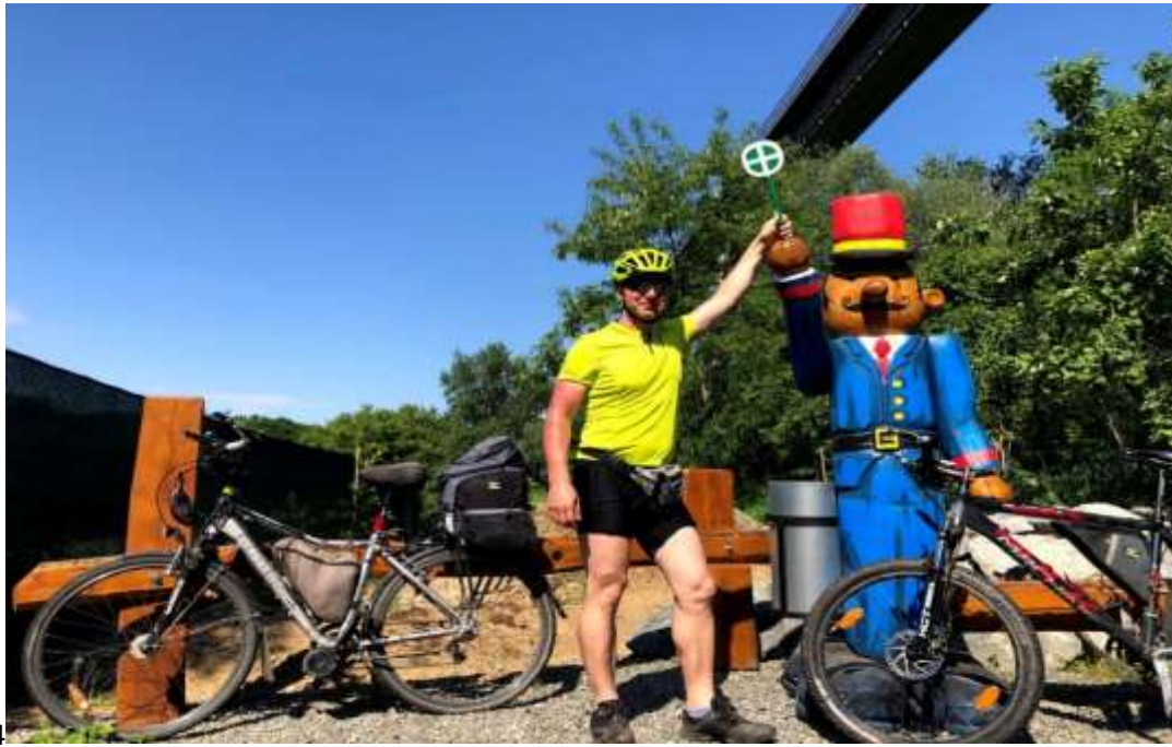
4 Zřícenina kláštera Rosa Coeli – Dolní Kounice