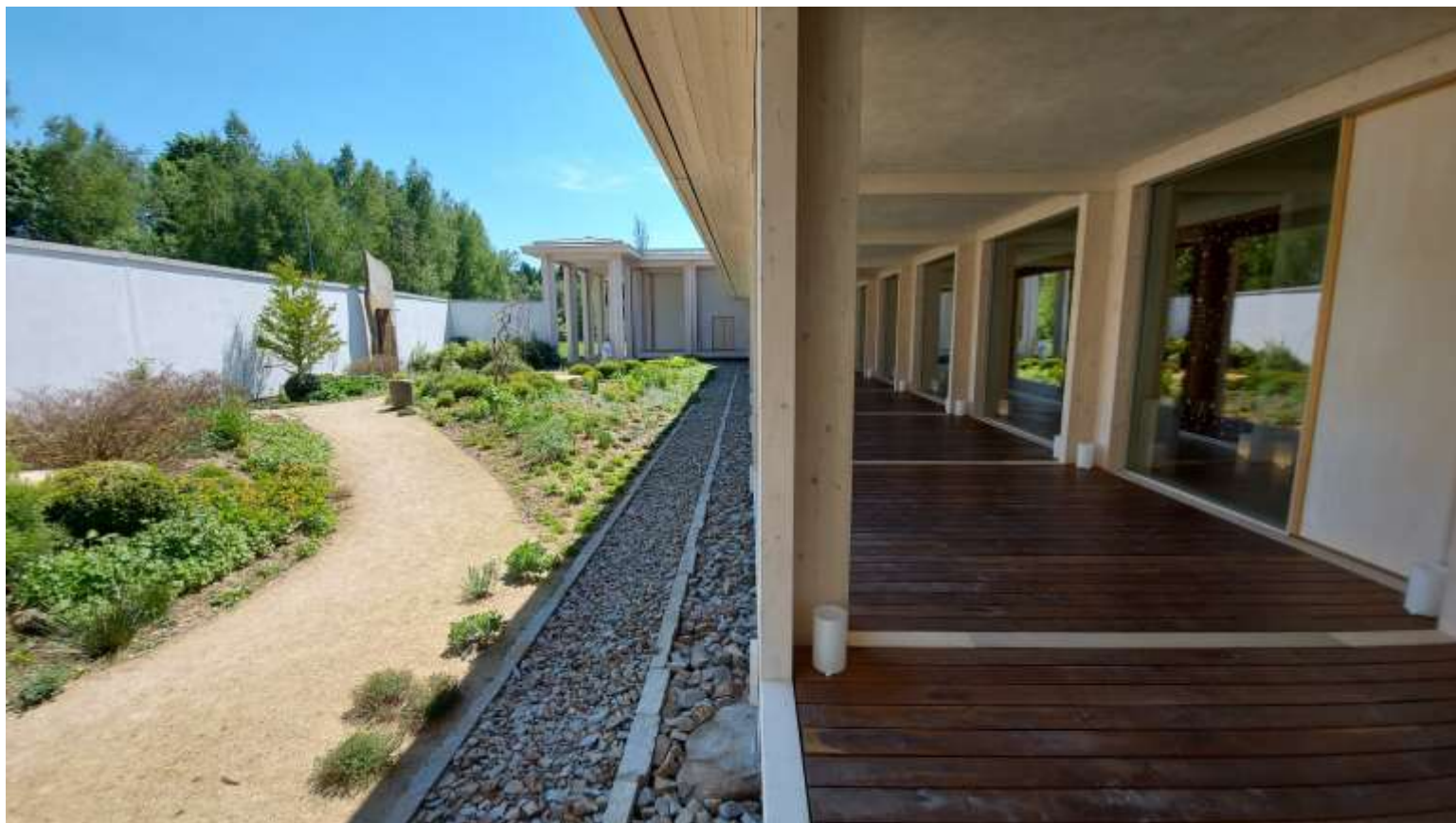
Ajuverdský pavilon....Svatá Kateřina.... Stavba roku 2019.....