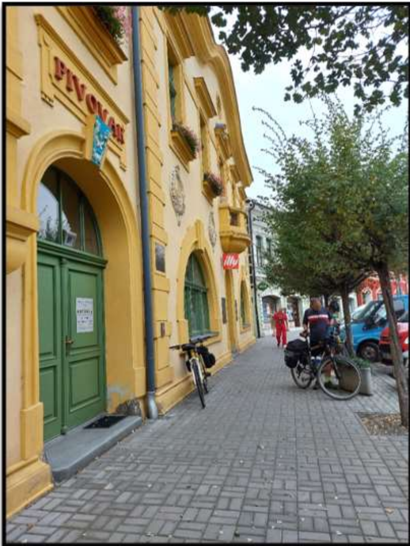
Pivovarský hotel v Kojetíně.....Olda zde zabezpečil chutnou obědovou krmi.....