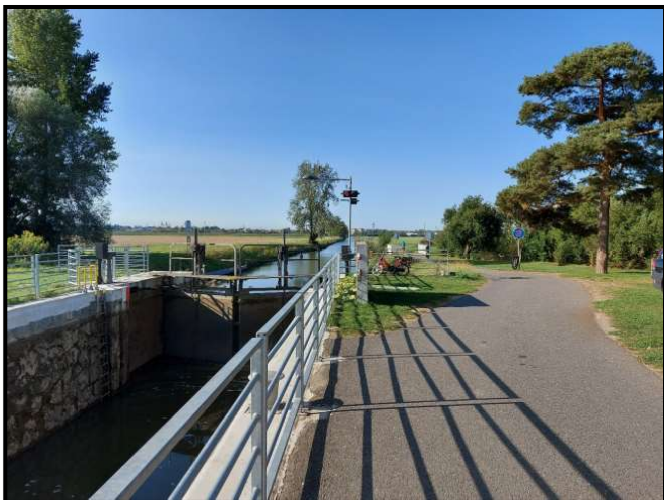
Zdymadla na svých cestách zásadně nepoužíváme.....Uherské Hradiště na dohled....