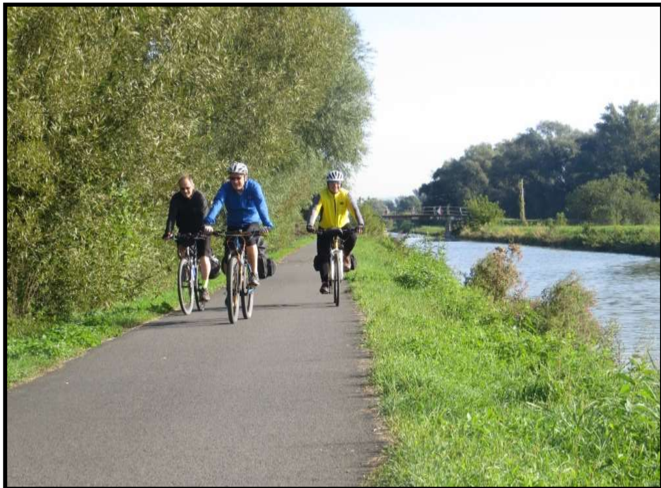
Veselá trojka se řítí kolem Bařova kanálu kolem Babic