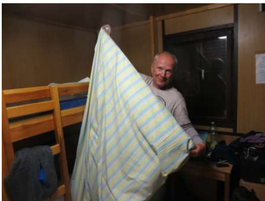
Tanec s prostěradlem.....