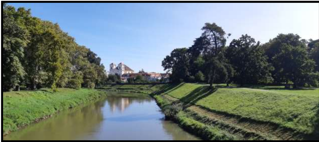
Park ve Veselí nad Moravou s Kostelem svatých Andělů strážných a klášter servitů