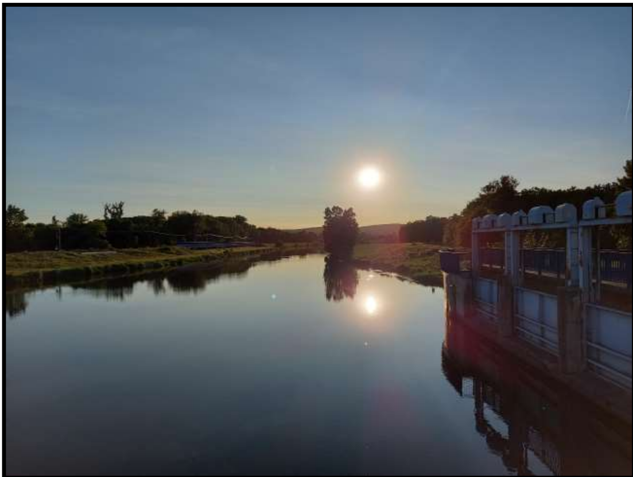
Zapadající slunce svítí na elektrárenský jez na 39,9, km Dyje.....