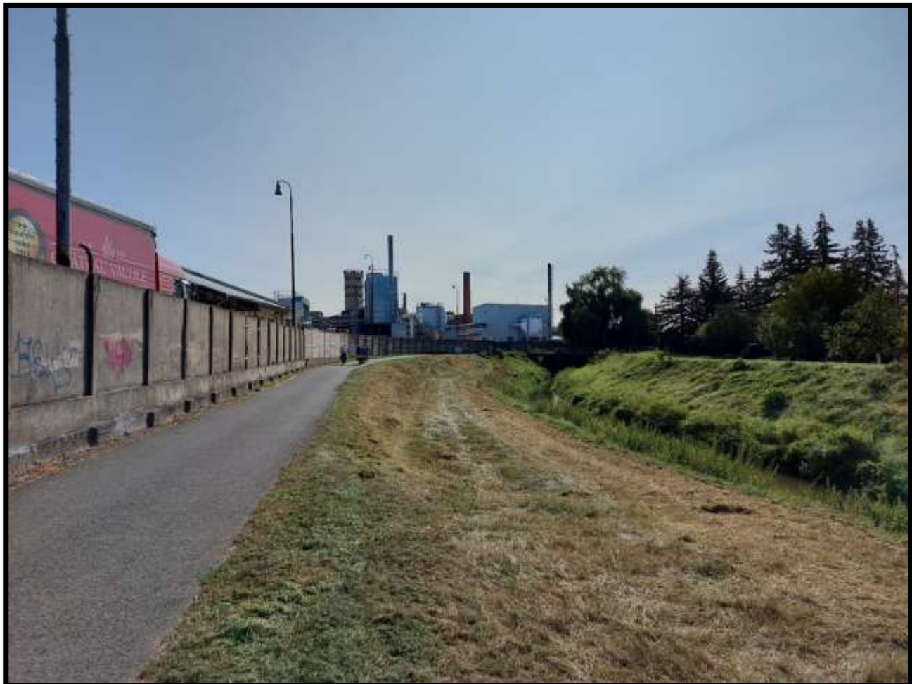
Uherský Ostroh.....je třeba se projet i průmyslovými zónami.....ty nás živí.....