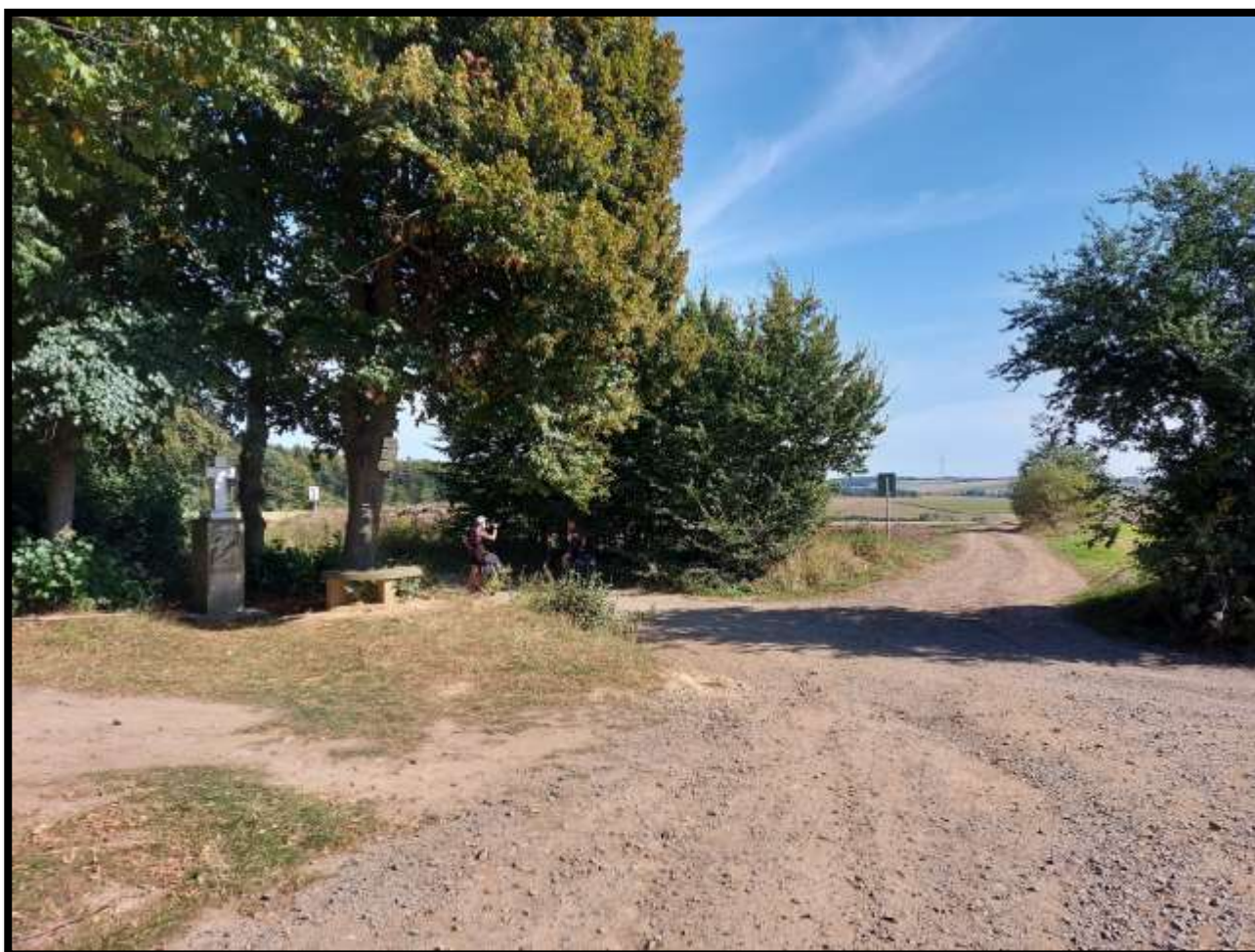
Rozcestí u Bílého kříže 622 mnm.....nejvyšší bod trasy.....vesnice Niva na dohled.....