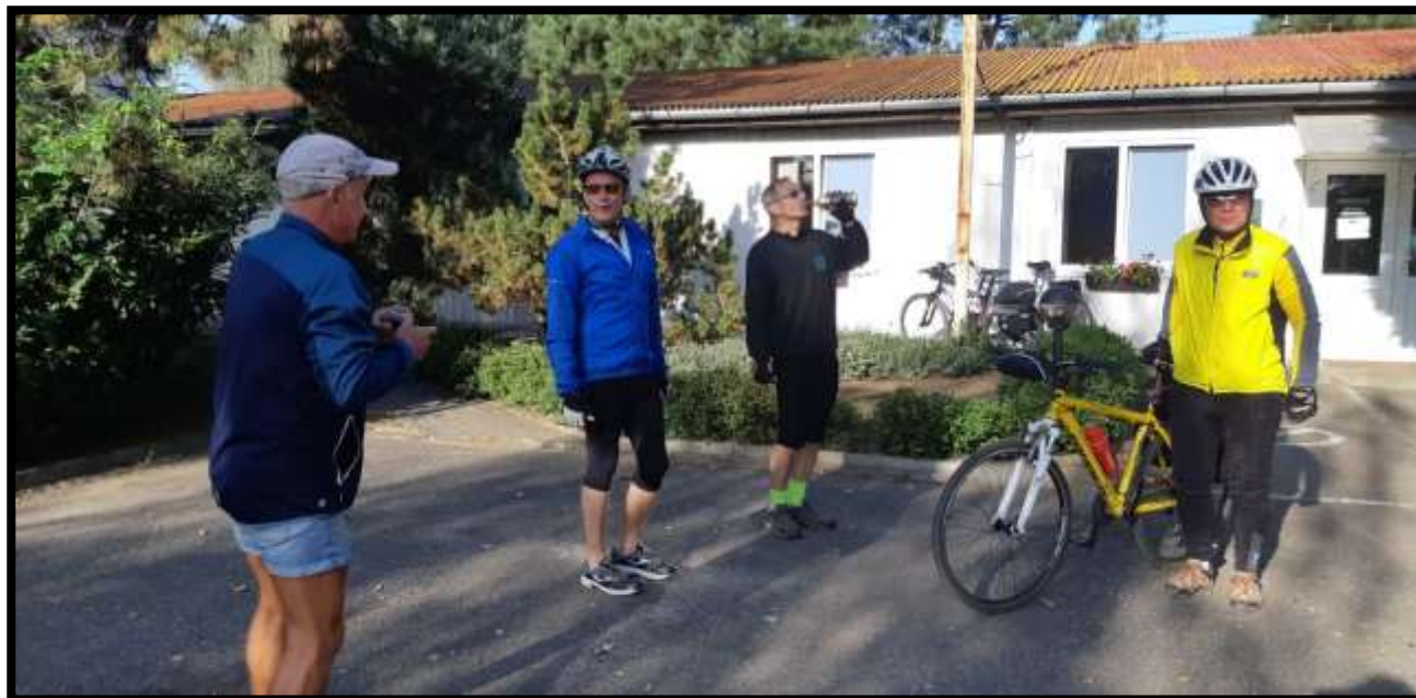
Spyihněv....Ranní nástup družstva....Whisky Grants k ránu patří....