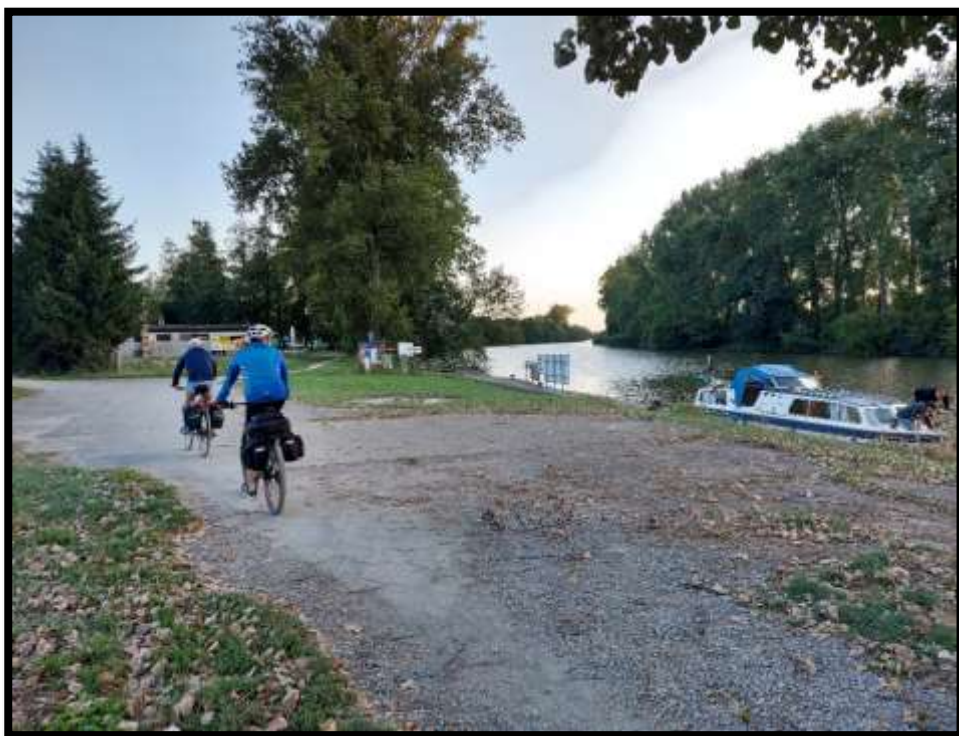
Přístav za Napajedly.....námořníci hledají kotvu.....