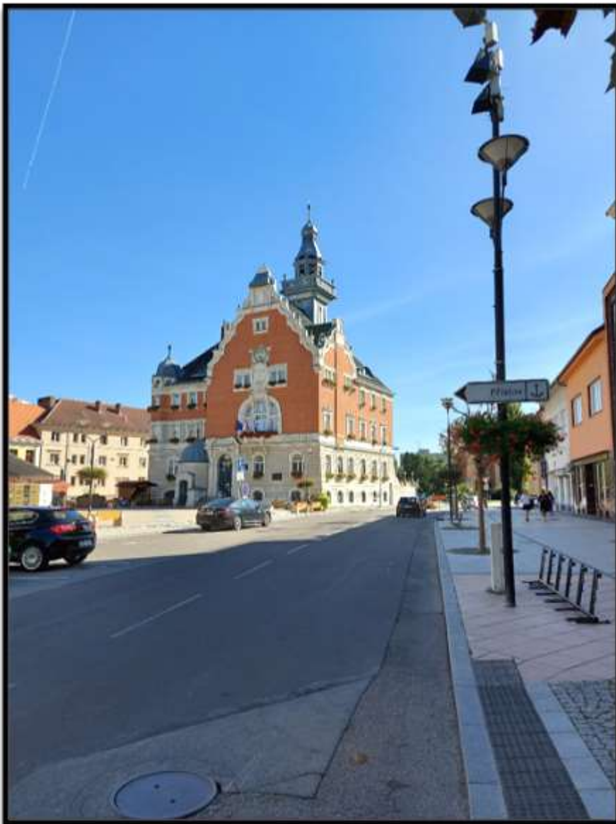
Hodonínská radnice..... pryč z města je tu nebezpečno....