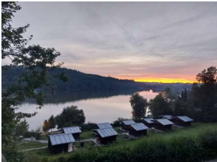
Podvečer na rybníku Olšovec u Jedovnice.....