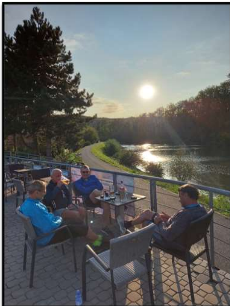
Napjedelské pastorele....Cyklostezka na nás čeká....