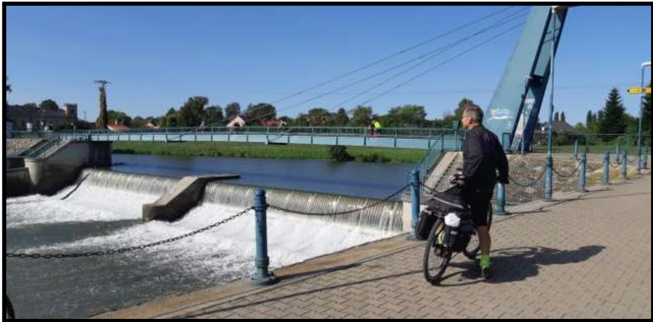
Veselí nad Moravou.....Správce Povodí Moravy je spokojen.....voda teče....