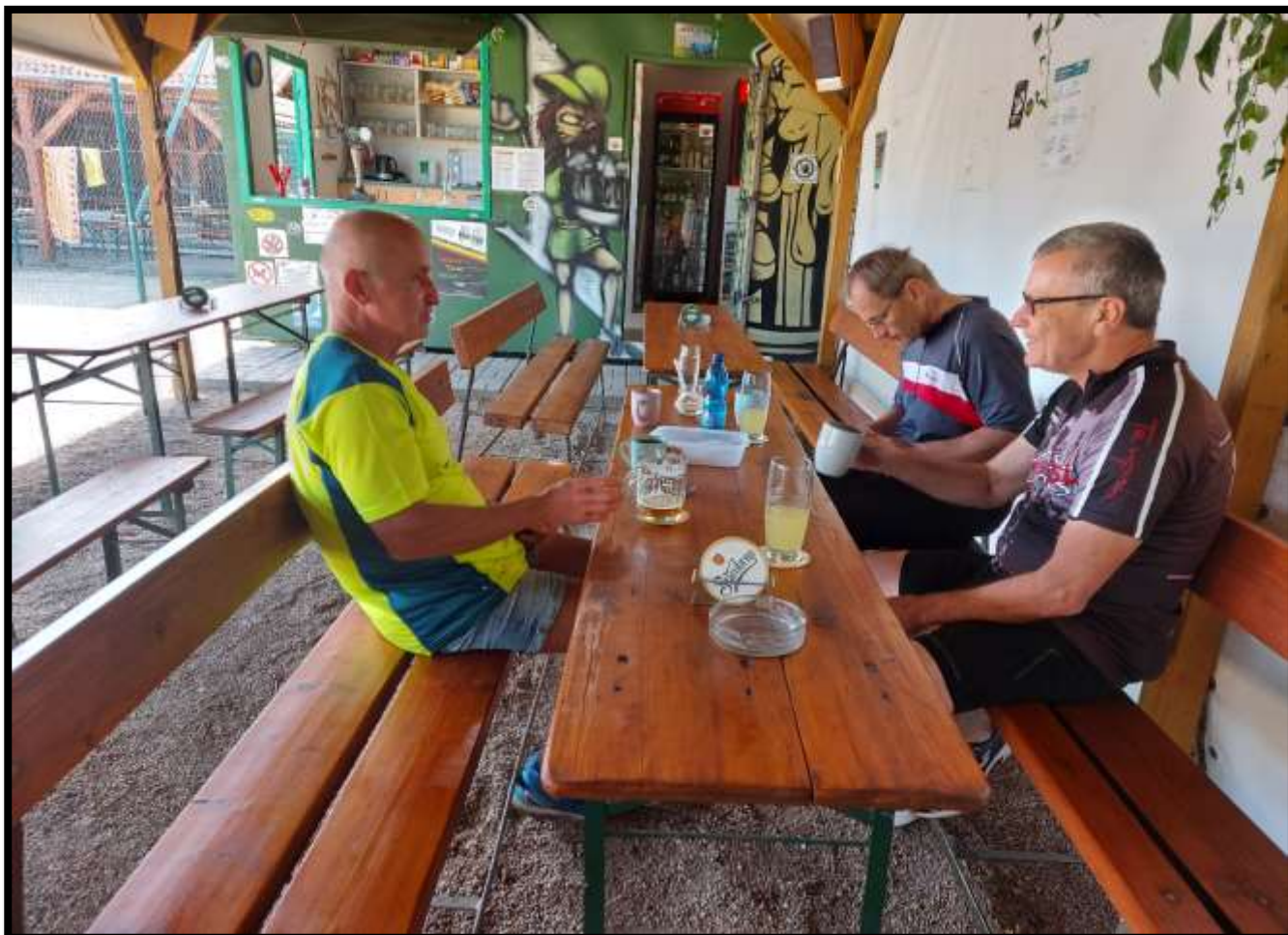
Stánek AVIA U 3 na fotbalovém stadionu SK Žabčice nám poskytl levné kvalitní teplé i studené nápoje....