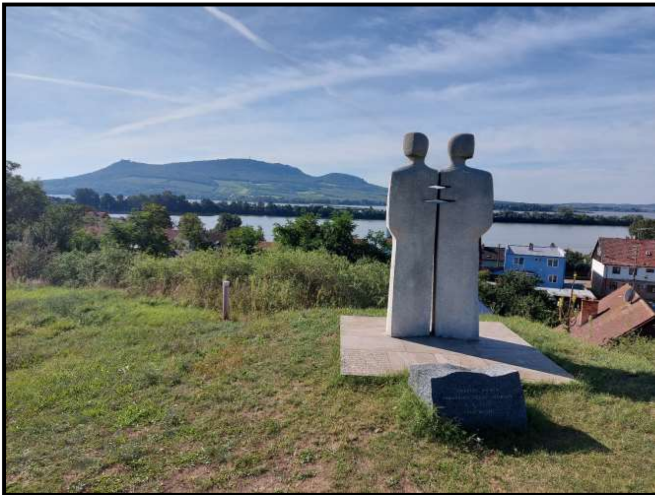
Památník Velké Moravy Cyril a Metoděj.....hmhm akorát nevím který je který....