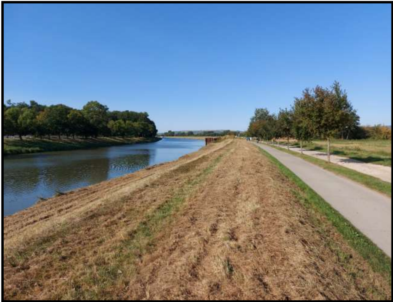
Okolo Hradišťa voděnka téče.....