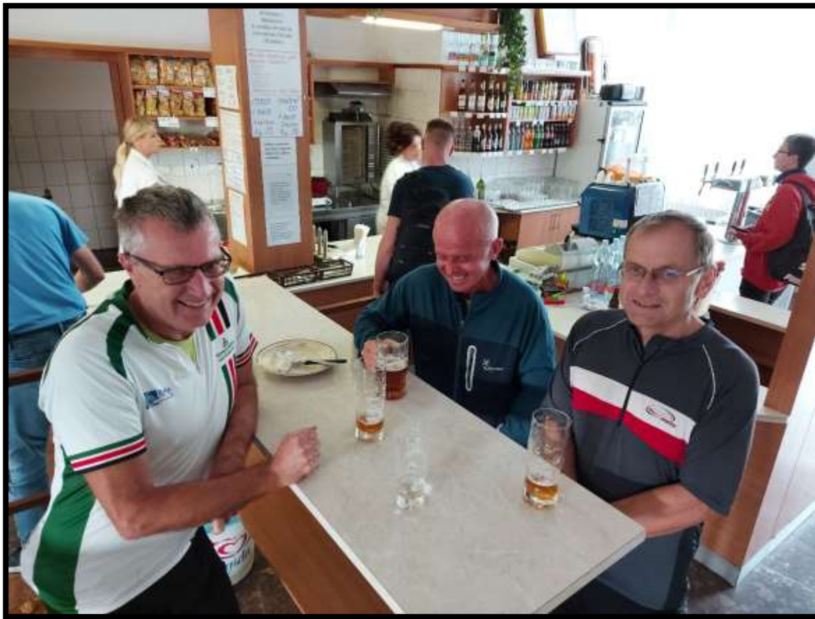
Otrokovice nádraží.....Kde se cítí bufetáči nejlépe?....