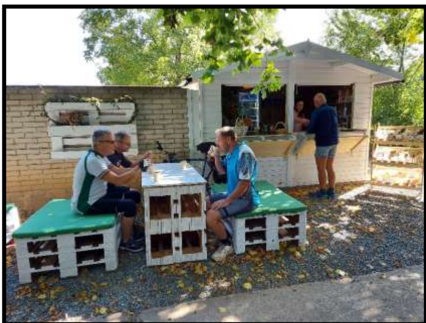
Ti pánové ve Strážnici u firmy Leros opravdu pijí čaj....věřte nevěřte....