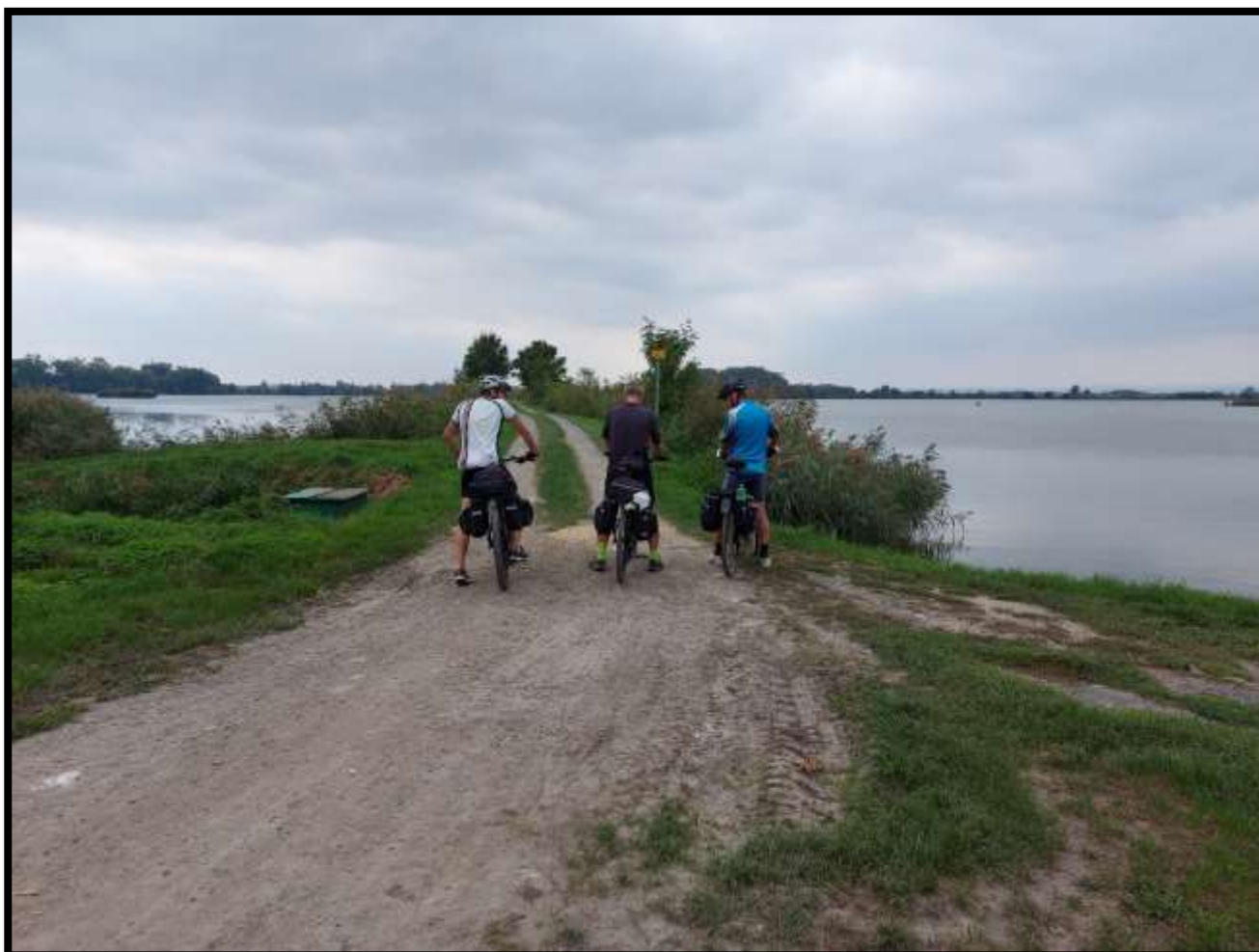
Hradecký rybník před Tovačovem.....máme trochu obavy vjet na úzkou hráz.....