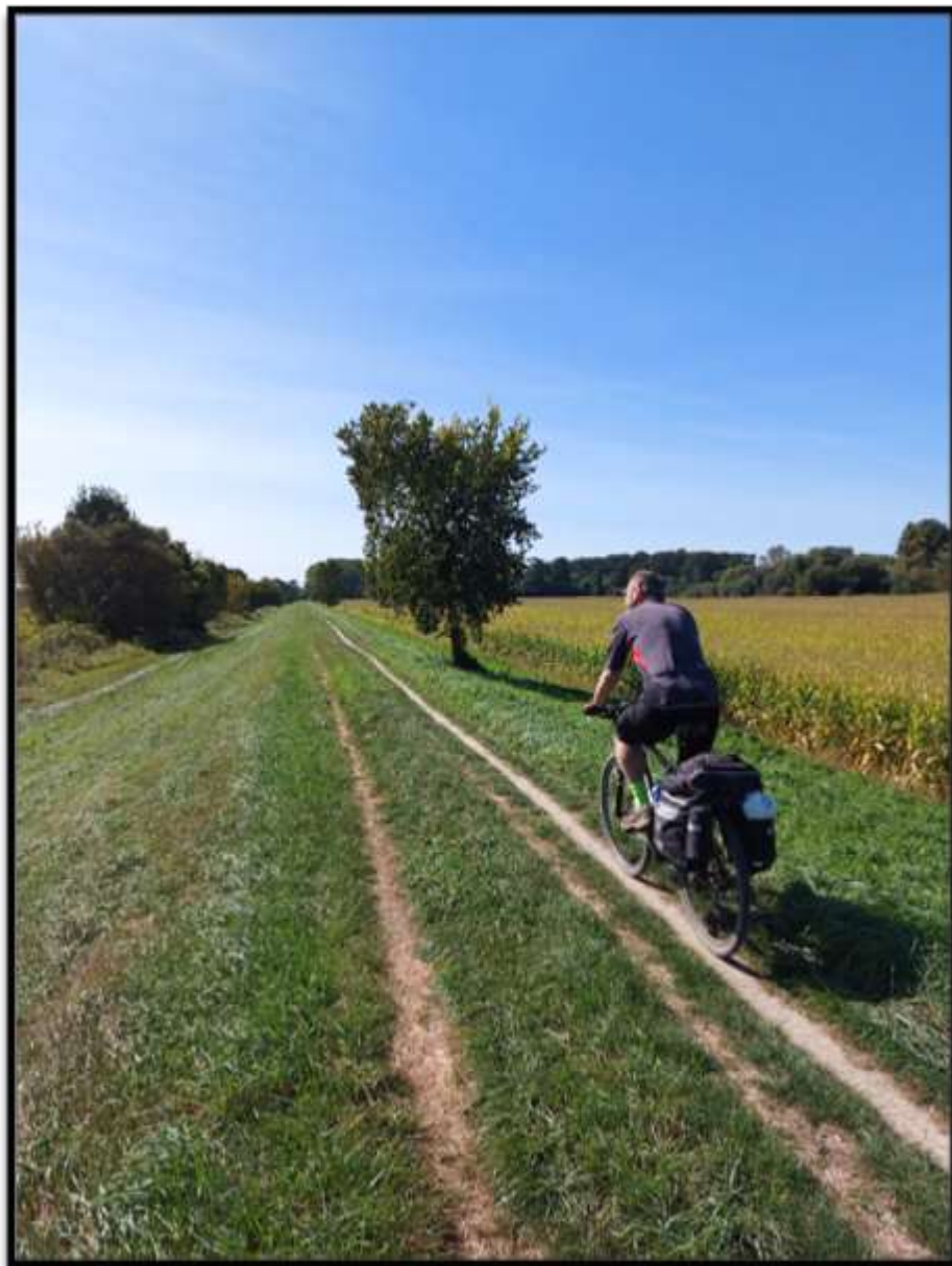
Letmý kilometr před Rohatcem v Jožkově podání.....