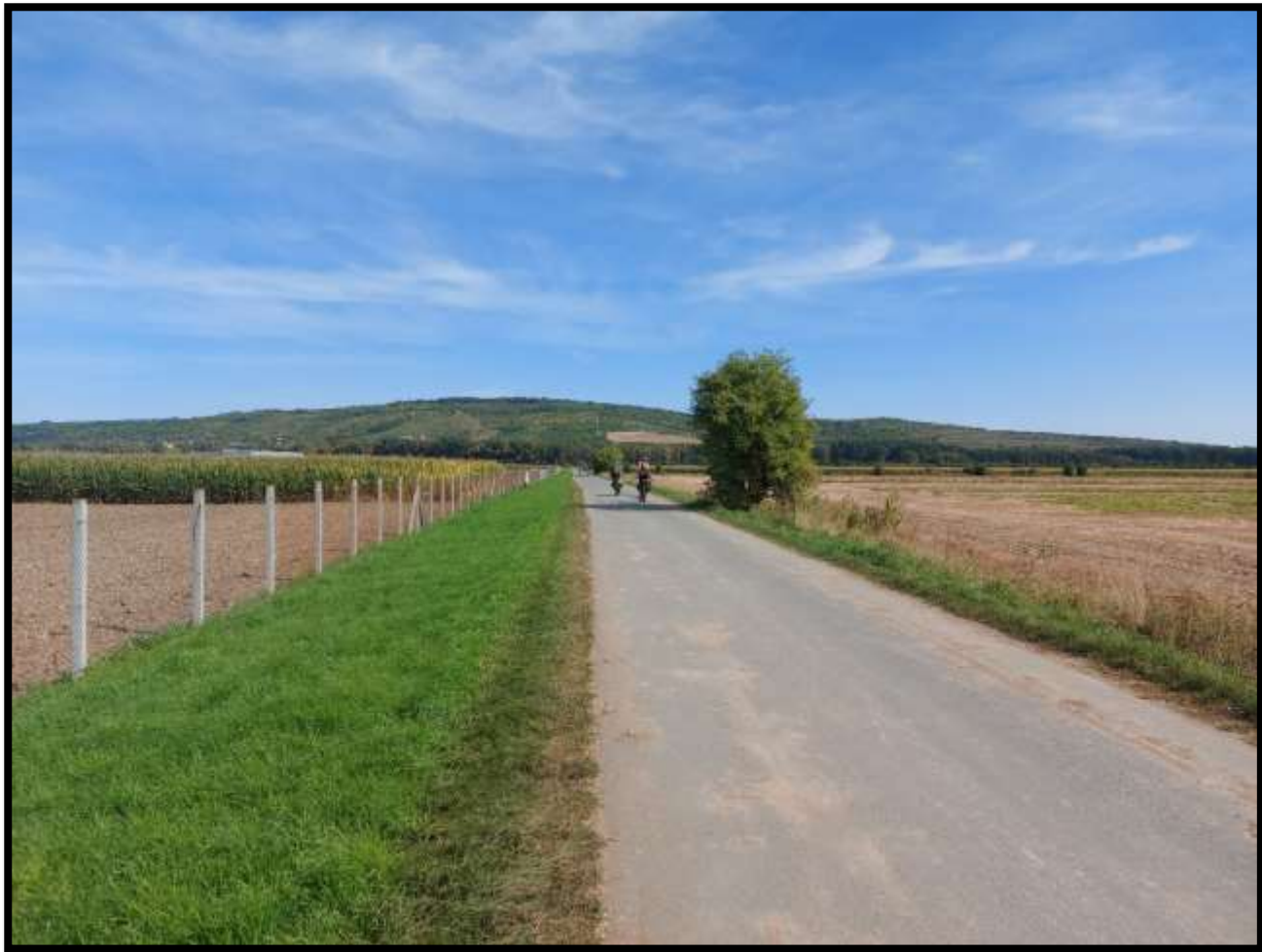
Hora Výhon nad Židlochovicemi ční do kraje.....