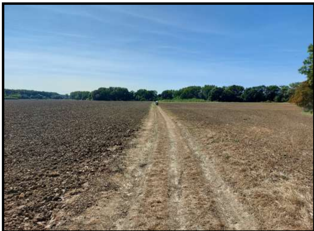
Jízdu po poli kolem Rohatce příliš neumím, přátelé jsou v čudu.....