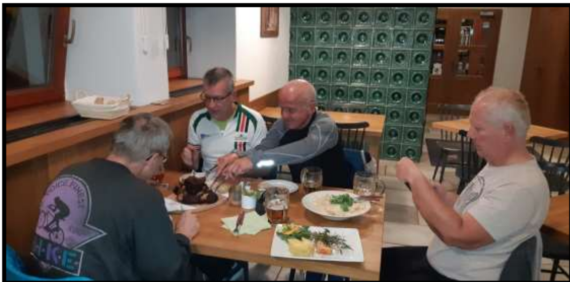
Nečum na ten mobil a jez, dívej jak pánové pěkně večeří.....Spytihněv večeře.....