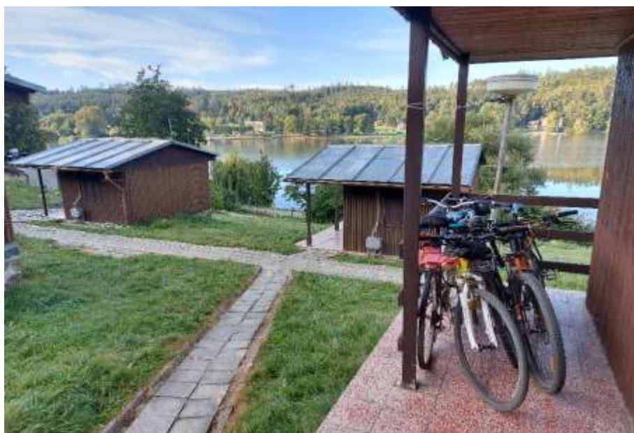
No to už se moc těšíme na ty zpcené pánské zadnice.....ráno u rybníka Olšovec.....