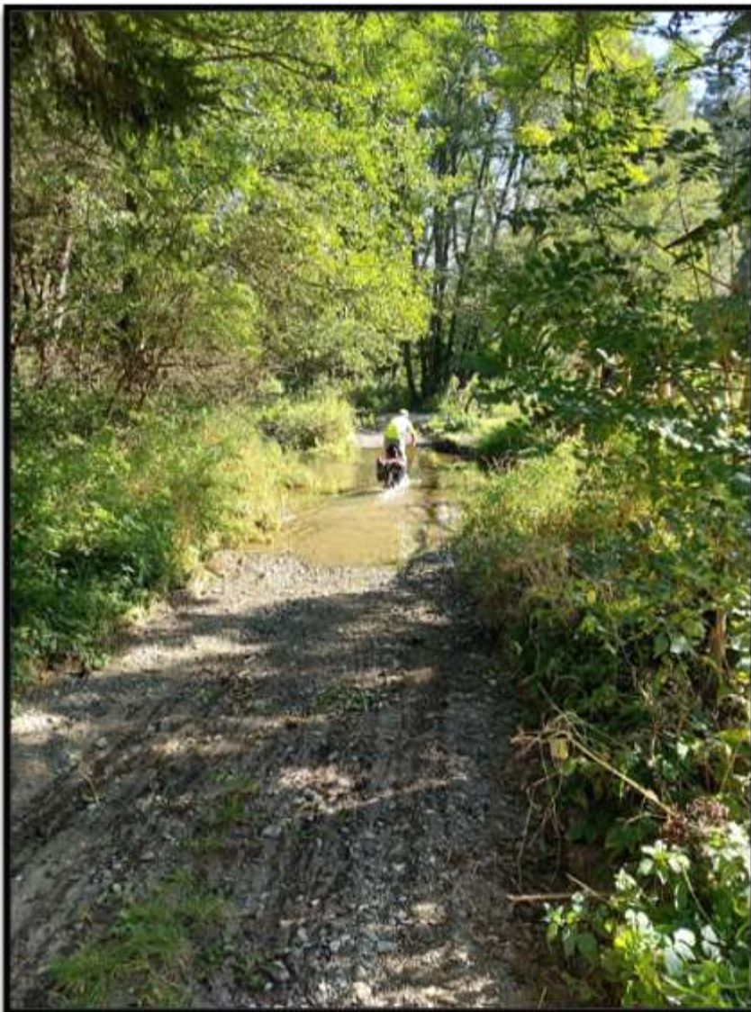
Zdeňkova síla paží a lýtek umožňuje průjezd v podstatě každým brodem...my jdeme po mostě...před Baldovcem