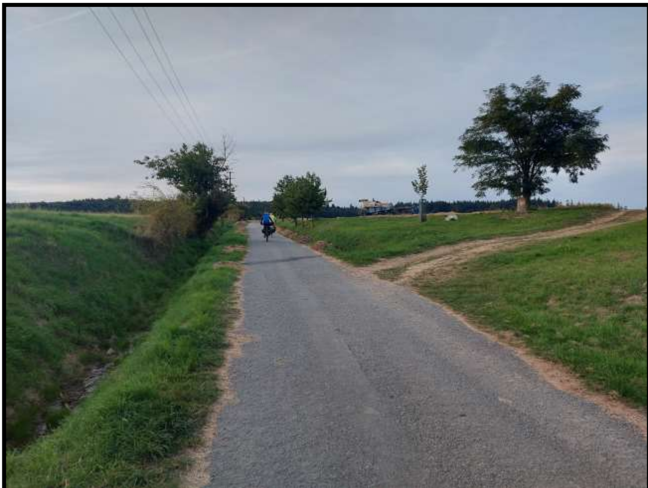
Podvečerní stoupání za Bukovinou....blíží se vrchol dnešní trasy a stíny se dlouží.....i kombajn už usíná.....