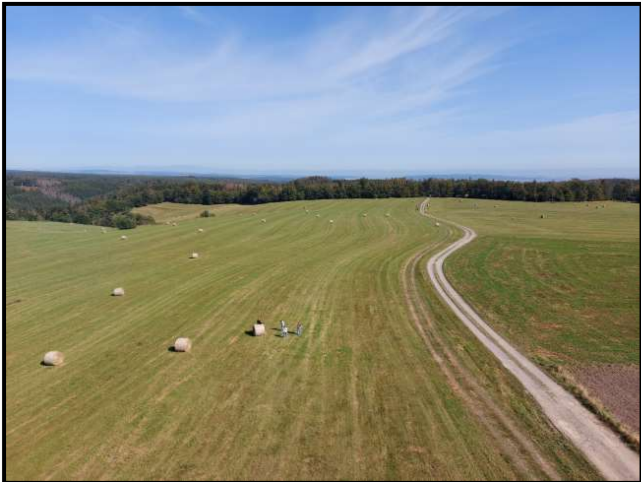
Cesta vede přímo k Hanackému Materhornu Kosíři 442 mnm....vlevo v dáli Jeseníky.....vlevo Repešský žleb cesta domů.....