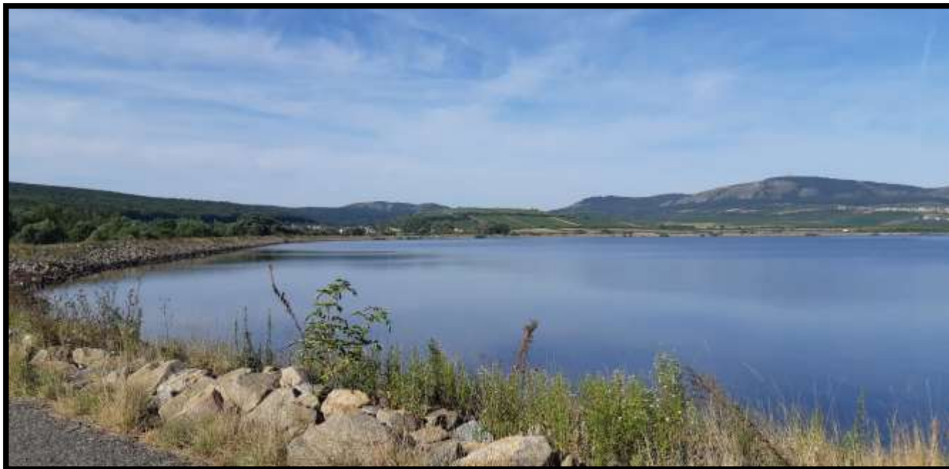
Fotky ze sobotní projížďky Oldovy skupiny.....