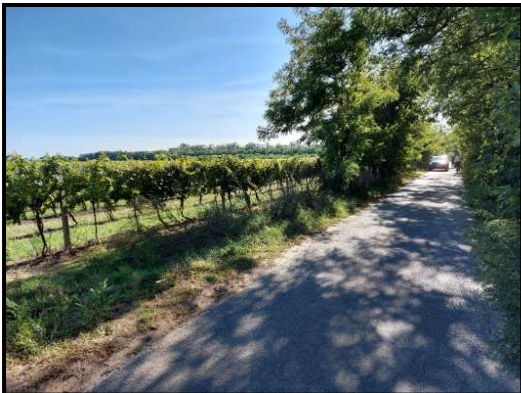
Lužice za Hodonínem.... vidíme první vinohrady....