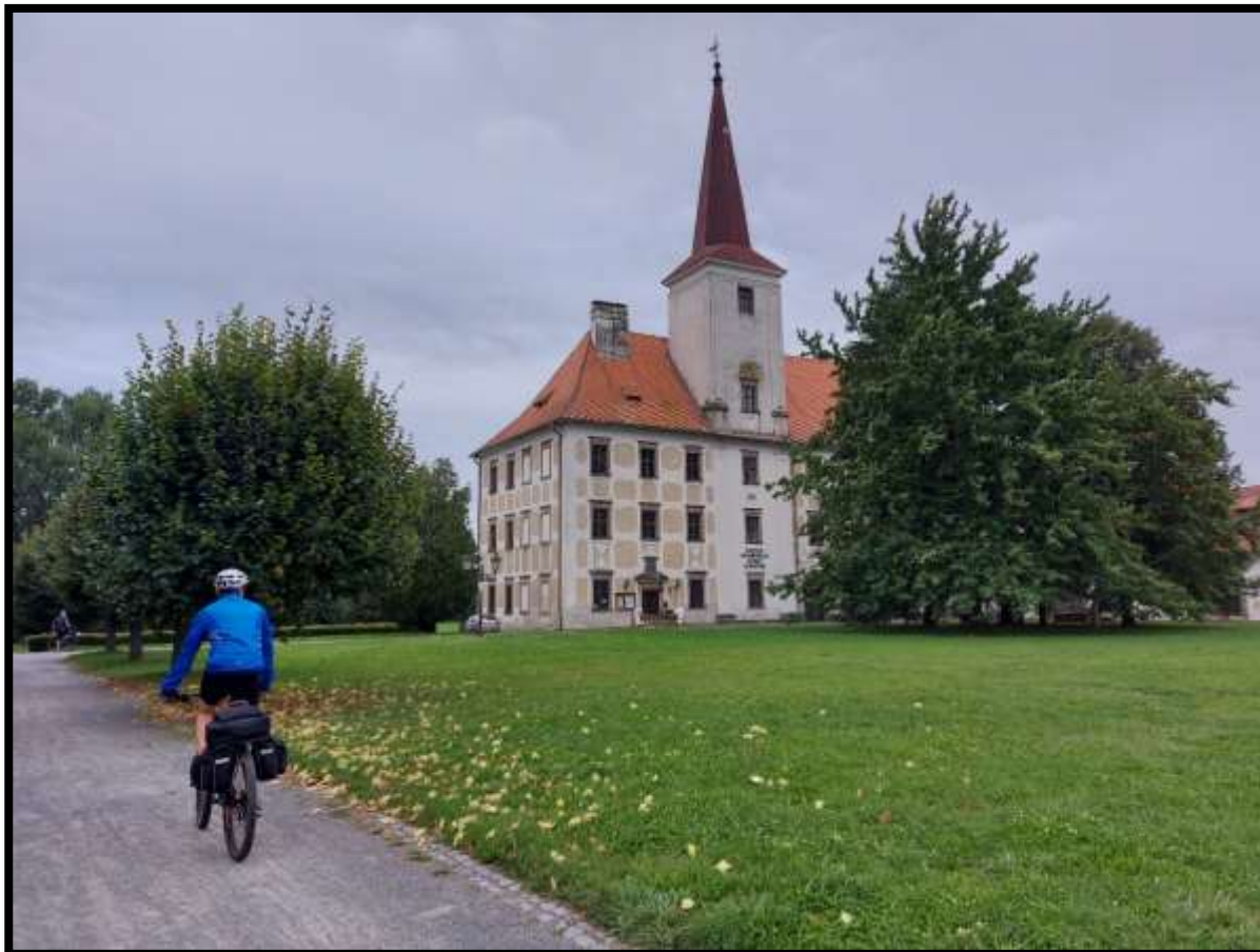
Štíhlá věž Zámku Chropyně je velmi podobná Honzově postavě.....