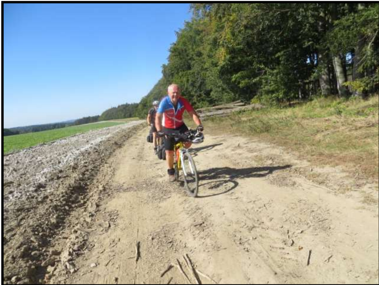
Cyklistovo snažení otočit koly v písku je nezměrné.....vrchol na dohled.....