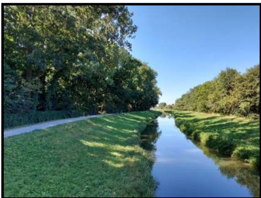
Bařův kanál kolem strážnického parku, kde často verbují a na 2 bubny bubnují