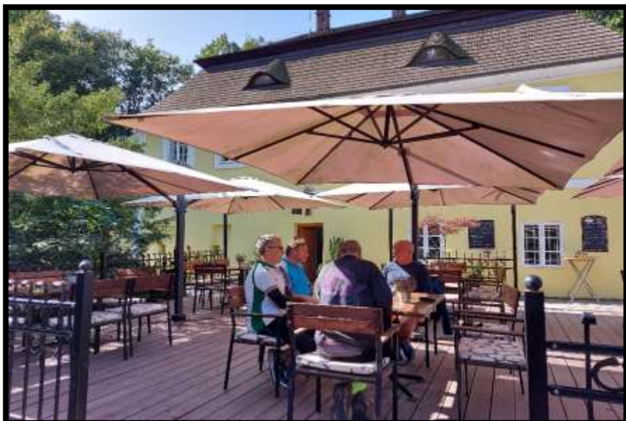
Kavárna v parku ve Veselí na Moravě nám nabídla kromě kávy také překvapivě valašský frgál.....