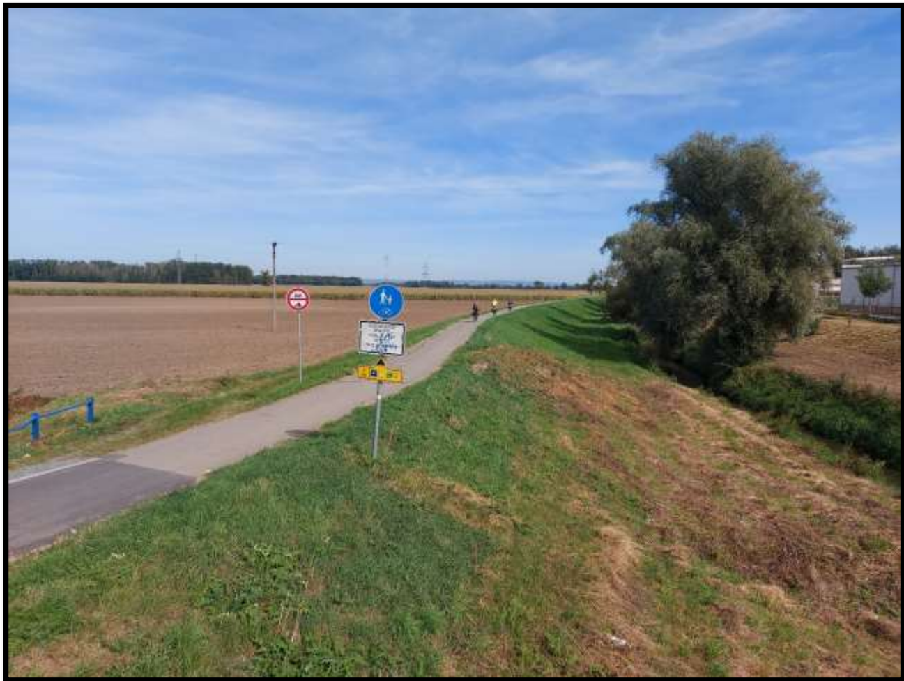
Občerstvení u Knedlíka jsme vynechali a míříme ku Šlapanicím.....