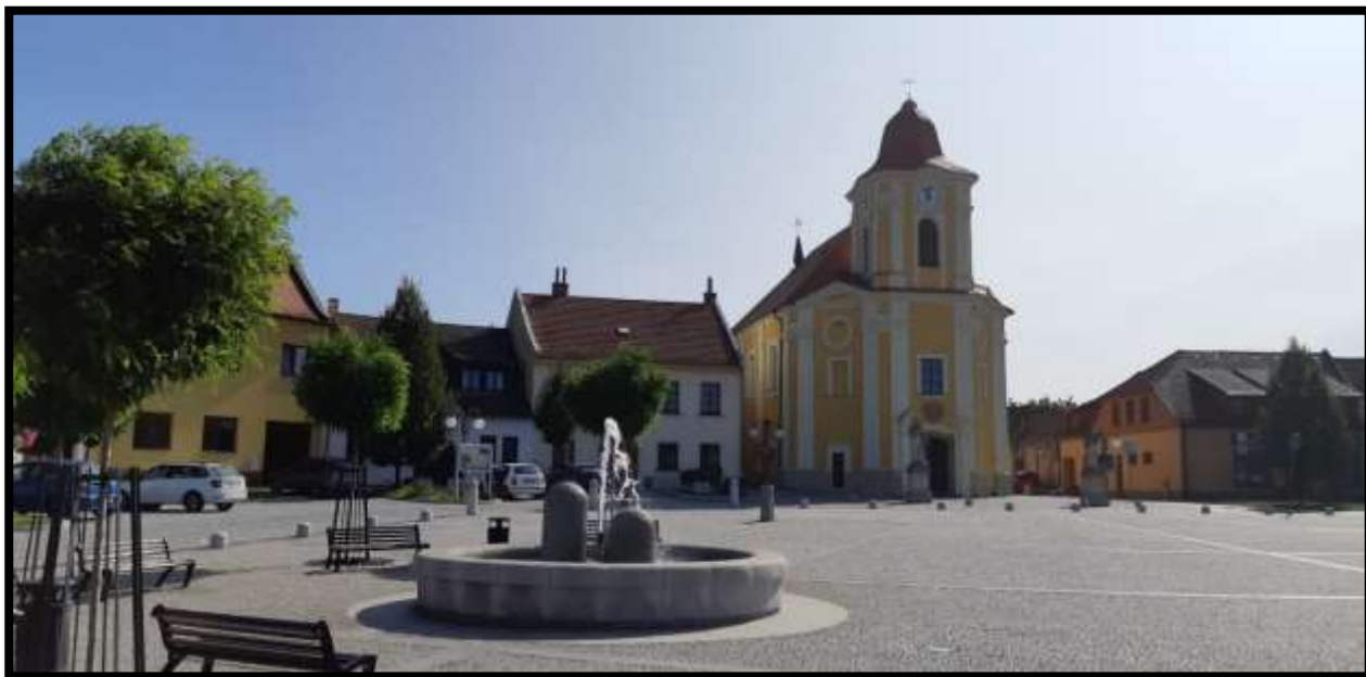
Veselí nad Moravou - Bartolomějské náměstí.....Rodiště známé běžkyně Aleny Smutné,,,,,,,,