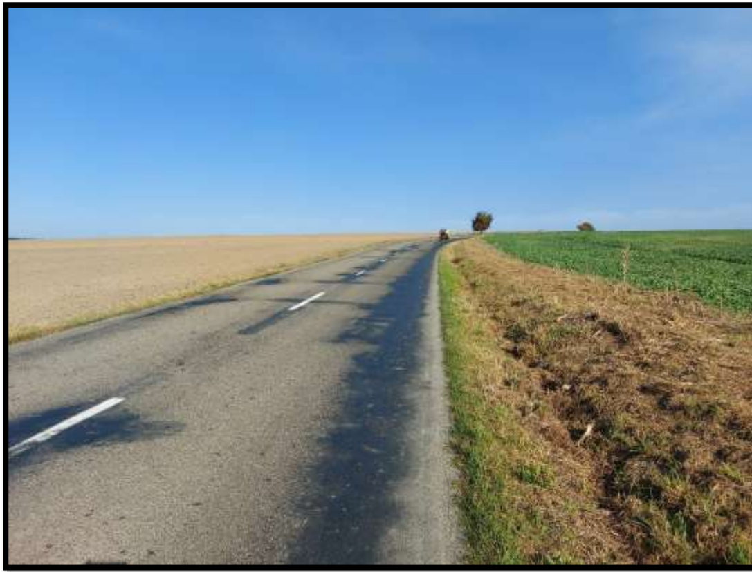
Stoupání nad Jedovnicí.....ráno již teplé.....