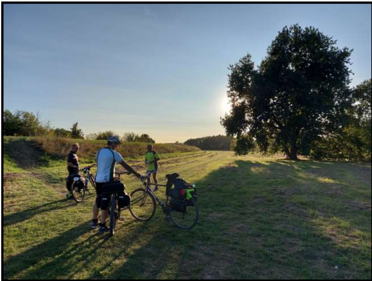
Hráz Dyje....poslední odpočinek před cílem v Pavlově....