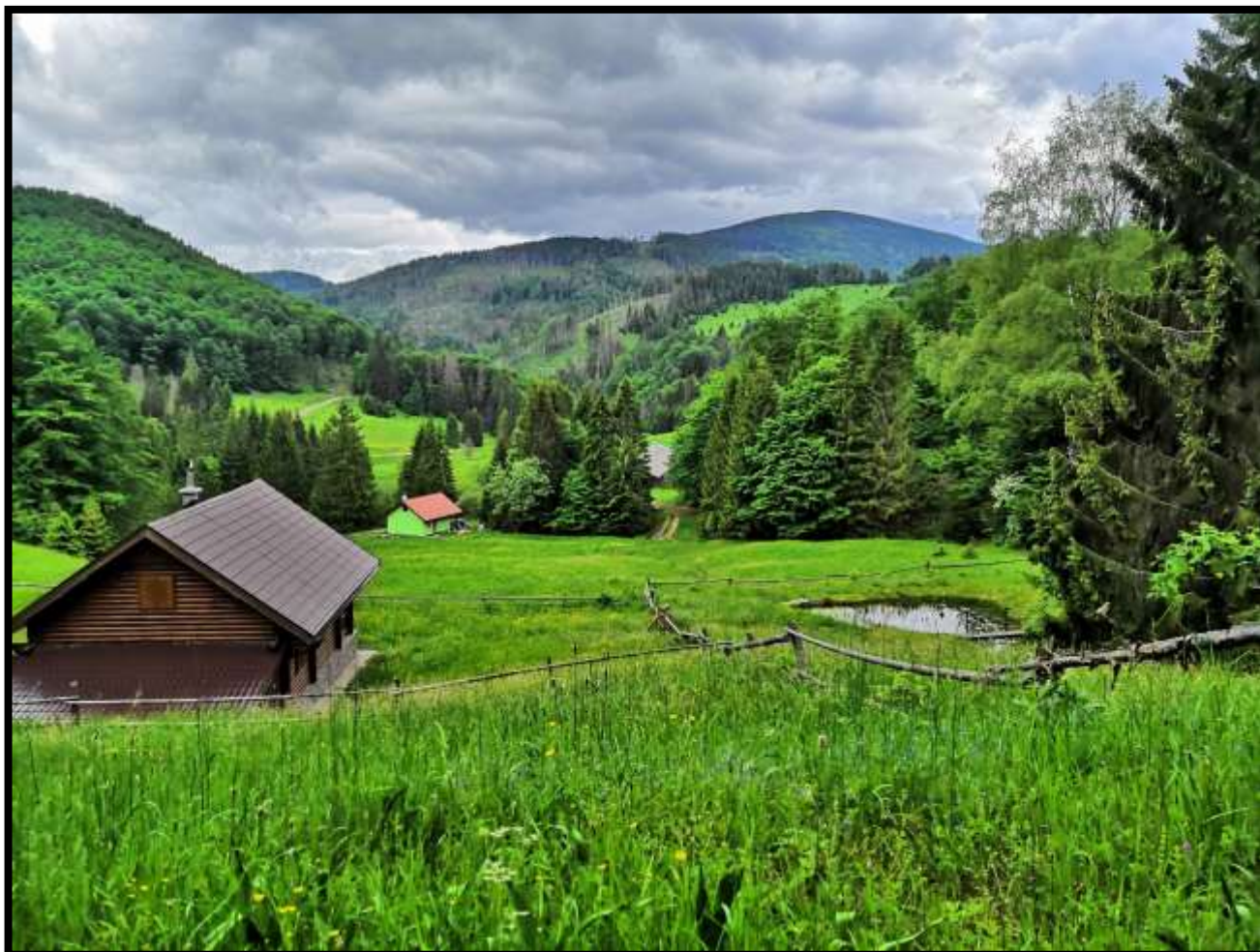
Výška 1000 mnm....Zolo podej prosím Fofovi nedovolené podpůrné prostředky....