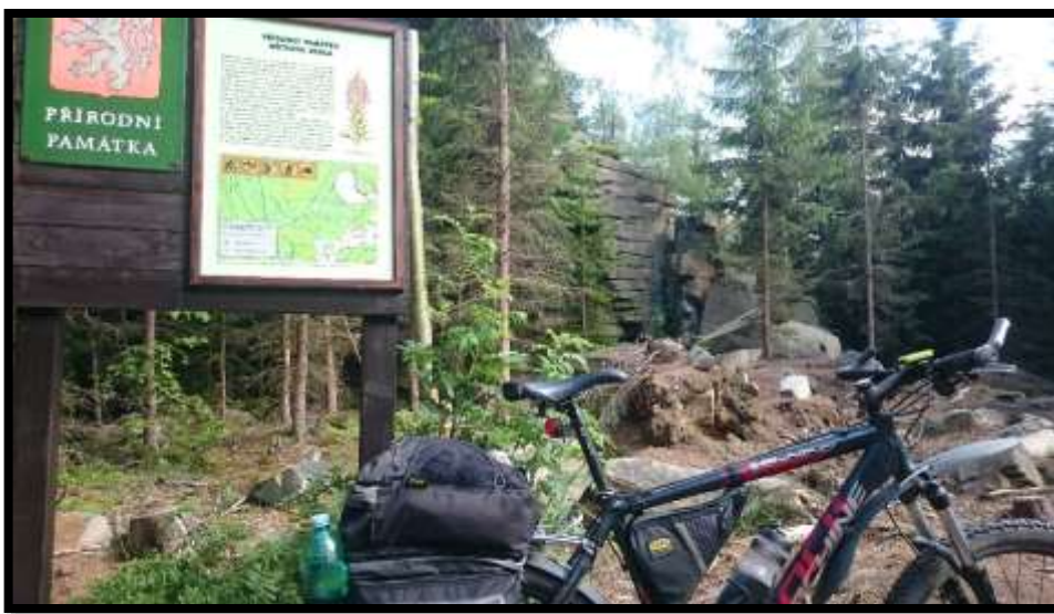
Přírodní památka Míchova skála a technická památka Zolovo kolo....sjezd z Javořice na jihovýchod.....