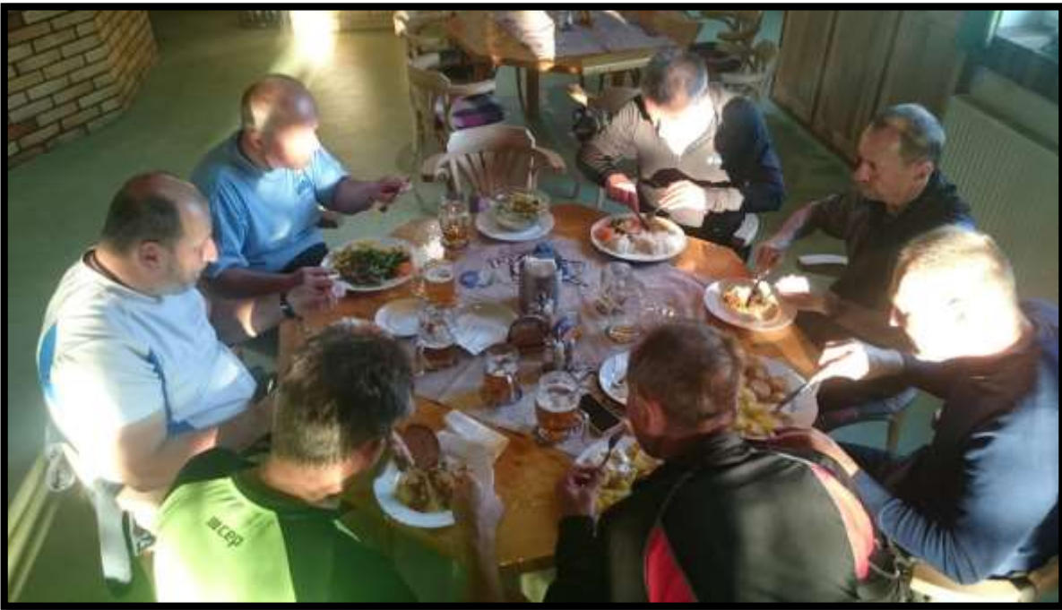
Rytíři u kulatého stolu.....