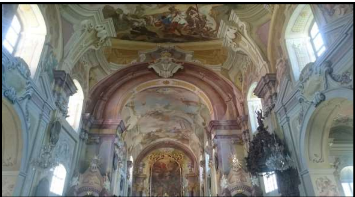
Barokní skvost kostel Nová Říše