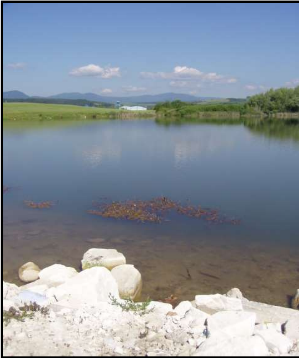
Nížinné pleso před Nováky s travertýnovým bílým splazem směřujícím k chaluhám nevzniklo ledovcovou činností nýbrž lidskou rukou....