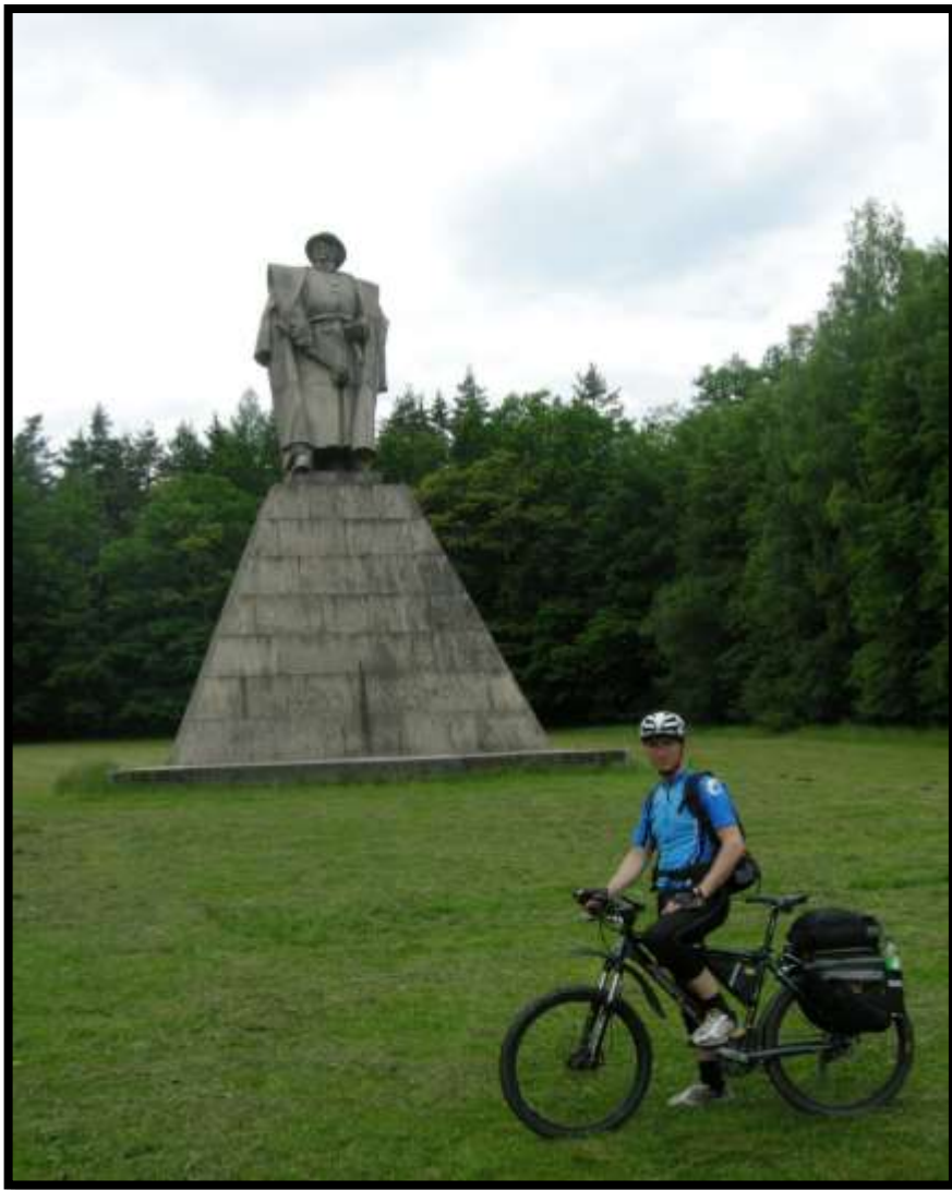
Setkání velitelů proti Zigmundovské koalici českých a maďarských spojeneckých vojsk u Trocnova...