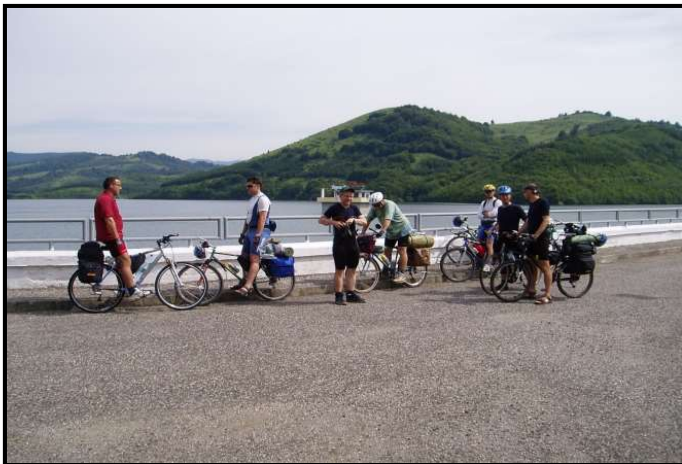
Ruské sedlo – hranice Slovenska a Polska – kola odpočívají po náročném stoupání